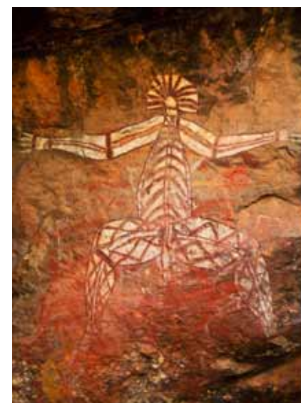
Rotstekeningen zijn heilige plekken voor de aboriginals. Links, vanaf linksboven met de klok mee: Gamba's staan op het menu van de Wildbush Luxury Lodge; een spannende ontmoeting bij Jumping Crocodile Cruise; dieren spotten kan ook vanaf het terras van de Wildbush Luxury Lodge.