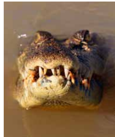
Sinds de jacht in 1971 werd verboden, zijn krokodillen niet meer bedreigd in Noord-Australië. Rechterpagina: Vee heeft voorrang op de wegen in Bamurru Plains, en het moerasland vol lotusbloemen is perfect te verkennen met een airboat.

Precies op de plek waar de droogte overgaat in wetland, staan de houten hutten op palen van de luxe lodge. Op mijn slippers loop ik met open mond door de tuin. Nou ja, het woord 'tuin' is hier eigenlijk verkeerd gekozen. Hier is een menselijk eilandje gecreëerd te midden van een gigantische biotoop waarin eindeloos veel dieren en planten leven.